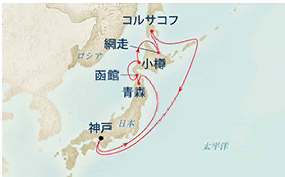
2015年 ダイヤモンド・プリンセスの予定経路