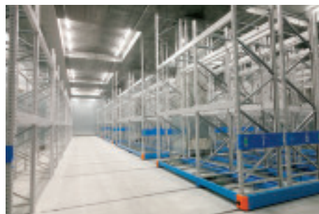
移動ラック式倉庫