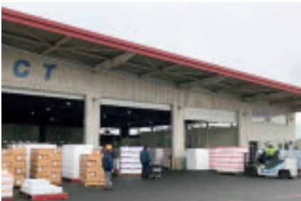
新千歳空港にある札幌国際エアカーゴターミナル(株)での輸出風景

この取組みにより、新千歳空港のリーディングゲートウェイ化と苫小牧港の食の国際物流拠点化を促進し、移出・輸出貨物の増加による千歳・苫小牧エリア及び北海道全体の地域活性化に貢献して参ります。