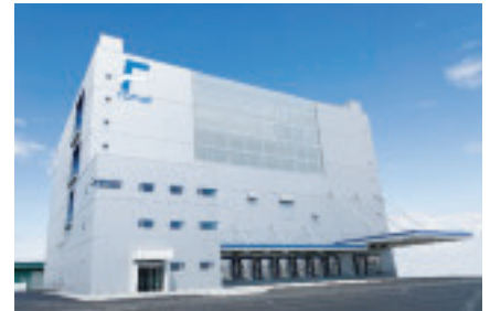
苫小牧埠頭(株)の運営する「北海道クールロジスティクスプレイス」