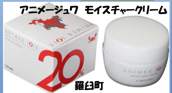
アニメージュワ モイスタークリーム