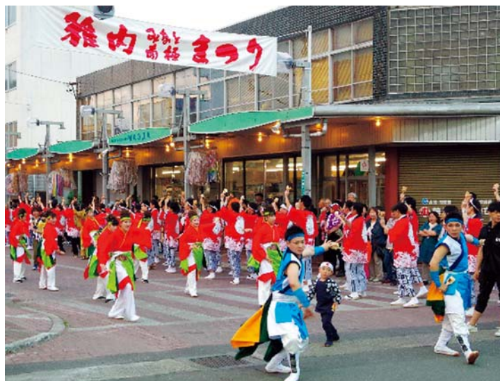
稚内みなと南極まつり