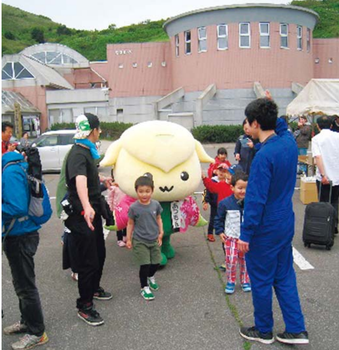
れぶんうめーべやフェスティバル (礼文町のマスコットキャラクター あつもん)