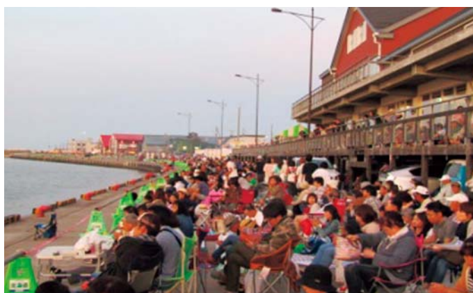
あばしりオホーツク夏まつり花火大会