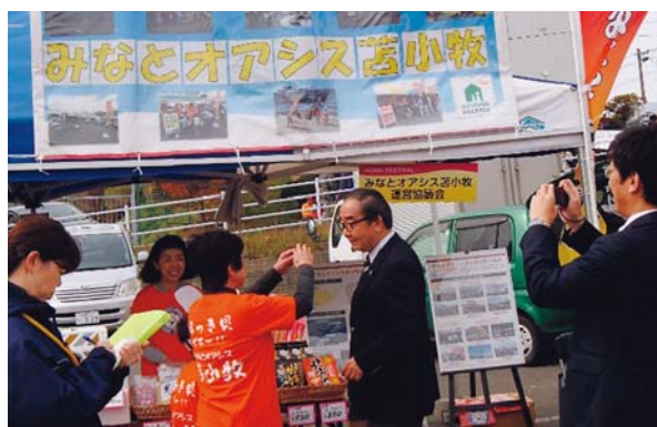
第 7 回ホッキまつり