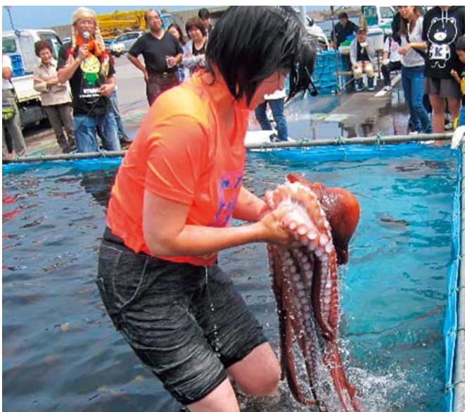
れぶんうめーべやフェスティバル (タコのつかみどり)