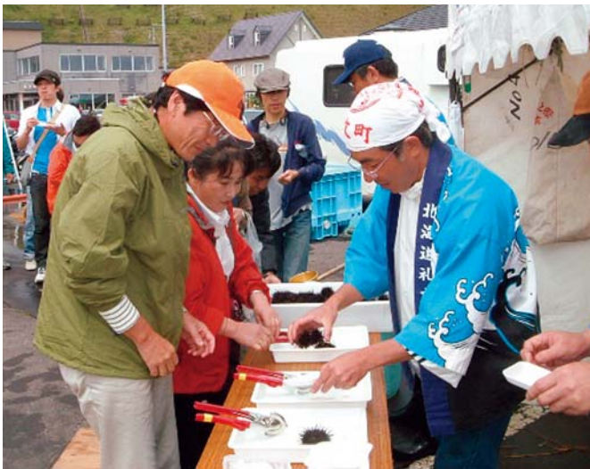
れぶんうめーべやフェスティバル (うにむき体験)