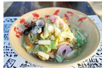
Sea 級グルメ (網走ちゃんぽん)