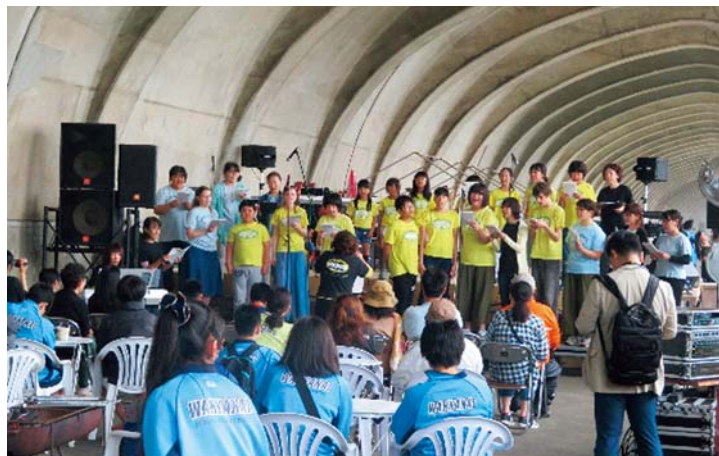
WAKKANAI みなとコンサート