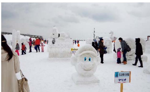
かまくらで遊ぼう