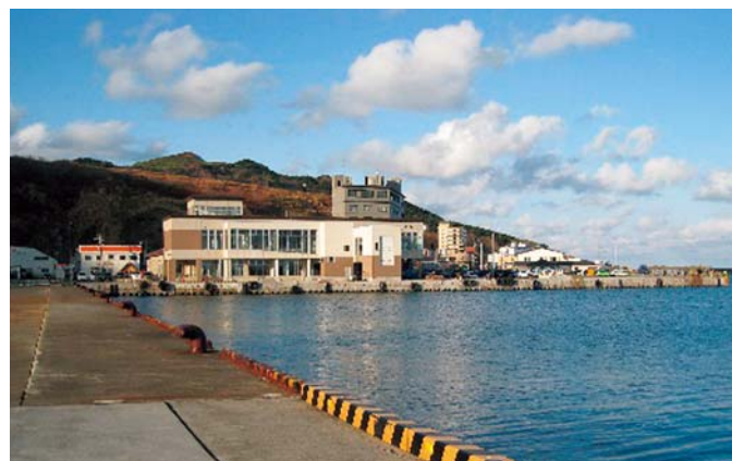
構成施設 (フェリーターミナル)