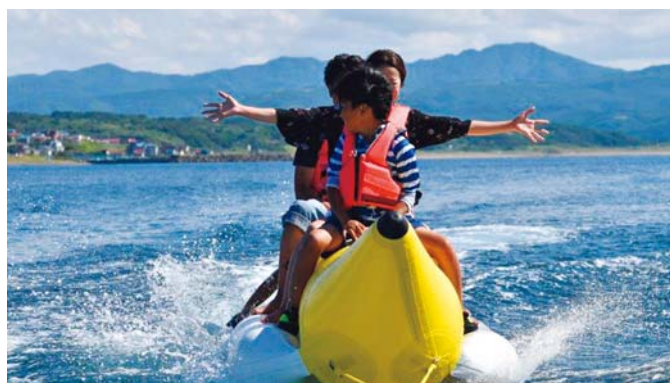
えさしまリンフェスタ