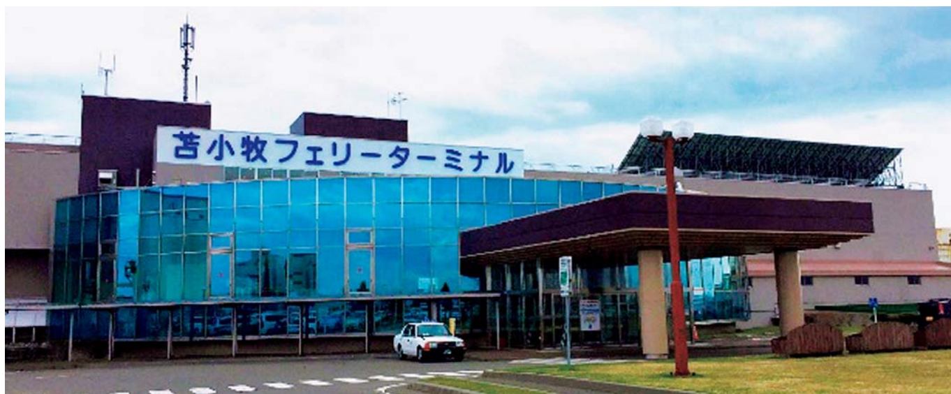
構成施設 (フェリーターミナル)