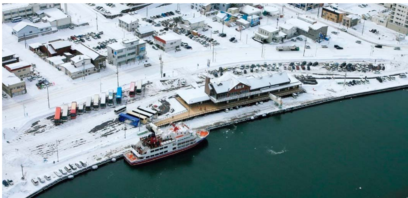
構成施設 (みなと観光交流センター)