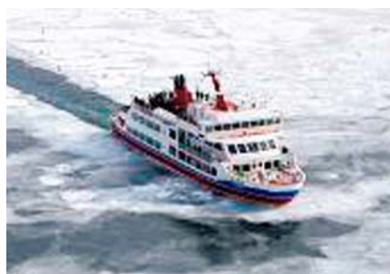
流氷野を航行する 流氷観光砕氷船