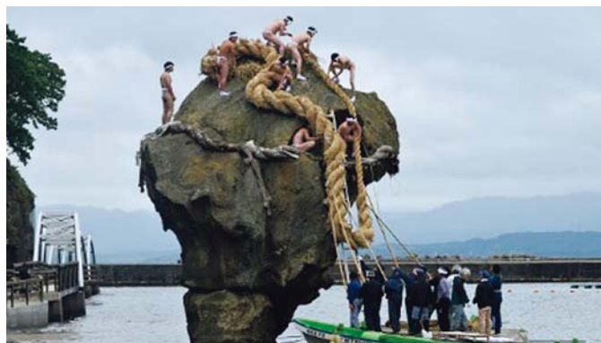
江差かもめ島まつり (瓶子岩大しめ縄かざり)