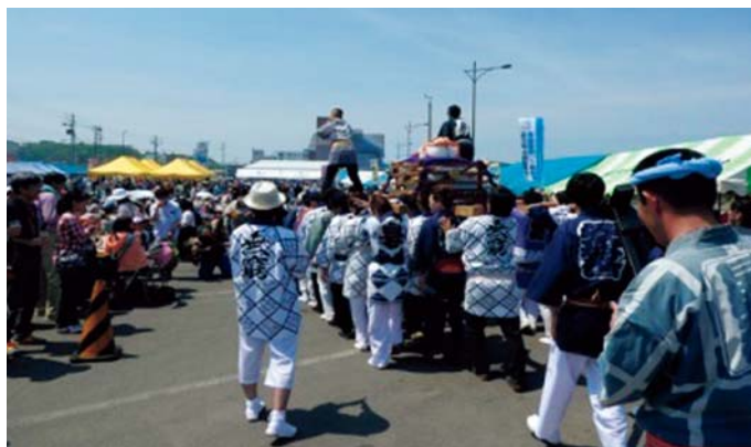
春力ニ合戦 in 網走