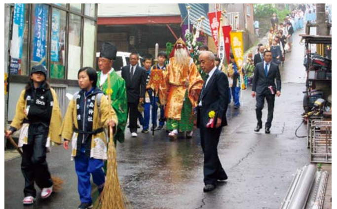
「れぶん」 巖島神社祭