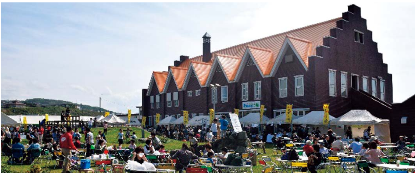
構成施設 (ぷらっと江差)