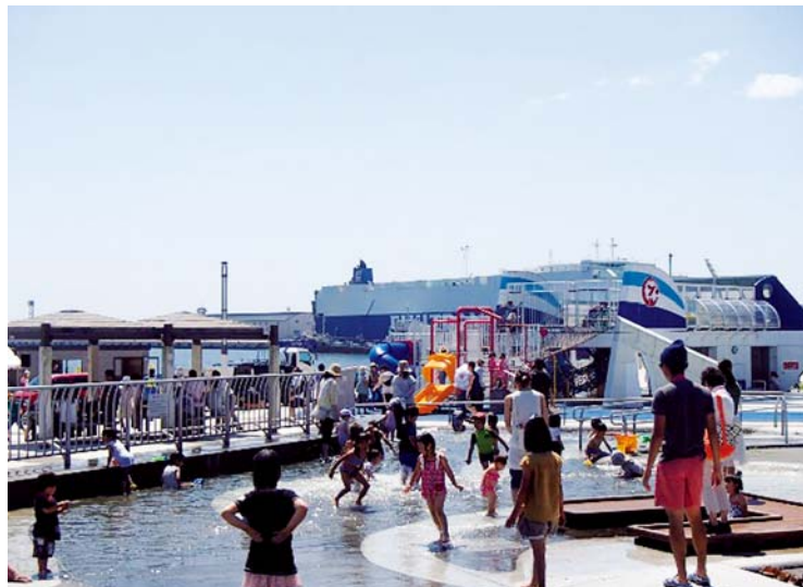
構成施設 (キラキラ公園)