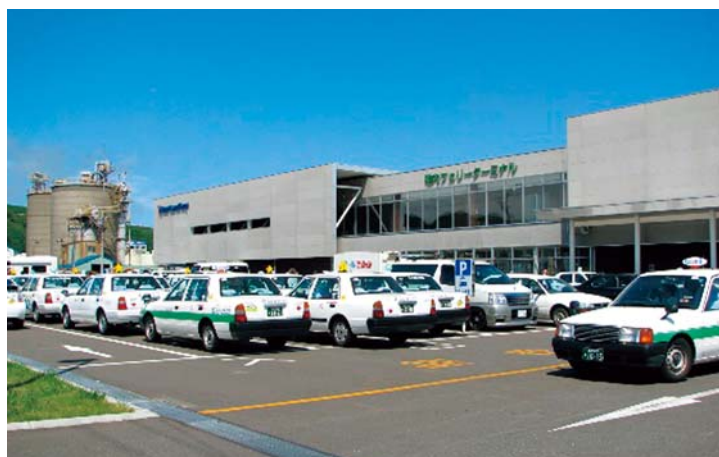
構成施設 (フェリーターミナル)