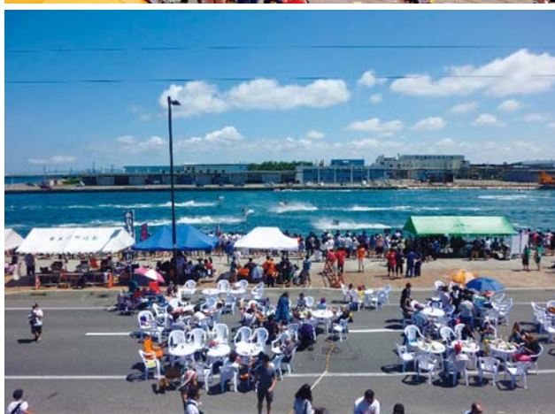
稚内副港ボートレース