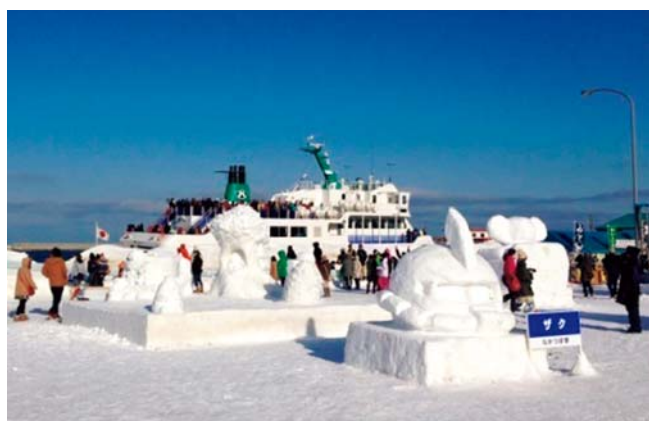
あばしりオホーツク流氷まつり