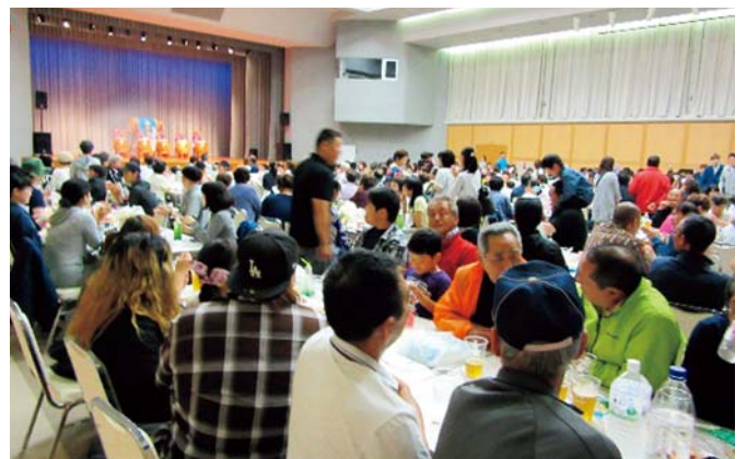
「れぶん」 海峡まつり