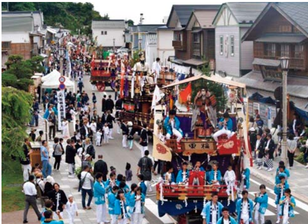
姥神大神宮渡御祭