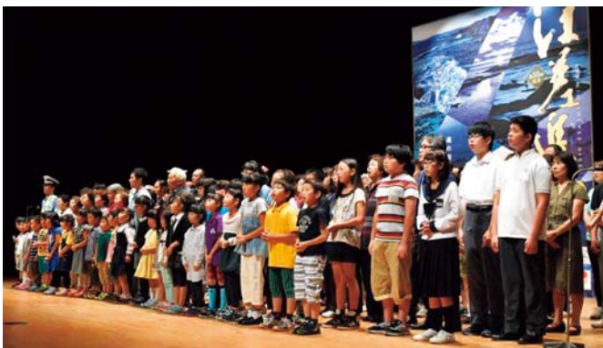
江差追分全国大会